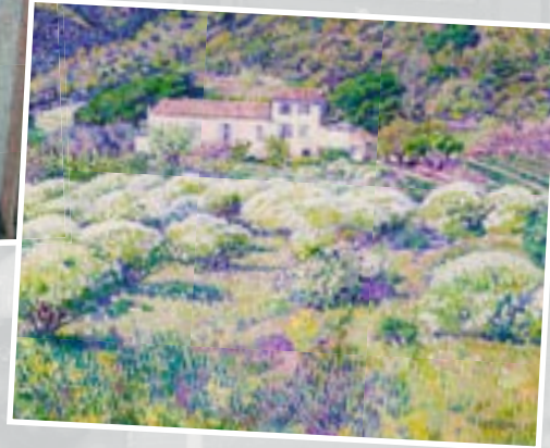
"Les Anthémis en fleurs" par Théo Van Rysselberghe 1904 | Collection particulière