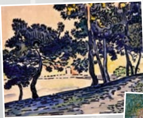
"Le Lavandou" par Paul Signac Ca 1895 | Musée d'Art Moderne Richard Anacréon (Granville-Manche)