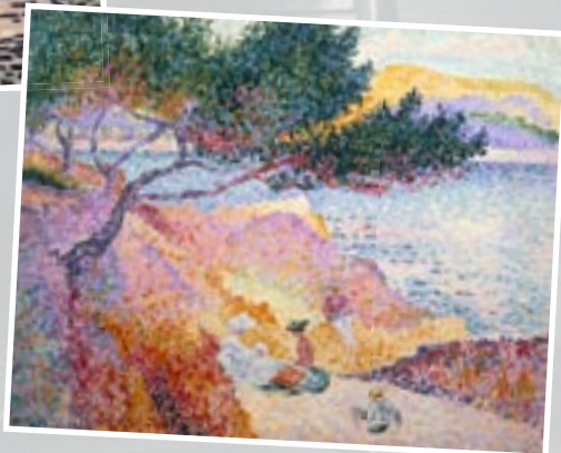
"La plage de Saint-Clair" par Henri-Edmond Cross 1907 | Musée de l'Annonciade (Saint-Tropez)