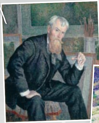
"Henri-Edmond Cross" par Maximilien Luce 1898 | Musée d'Orsay (Paris)