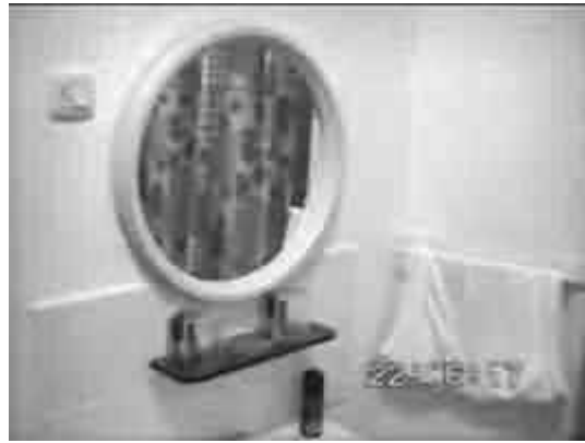
Il mitico albergo a Málaga