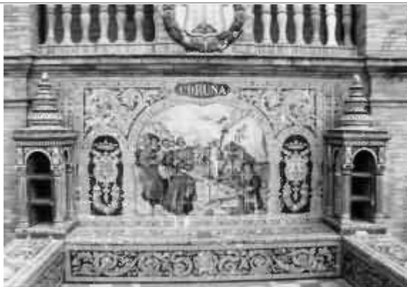
Plaza de España: uno dei mosaici