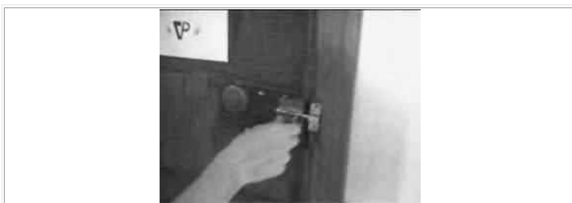
La pensione Vergara con la mitica serratura

L'ultimo giorno andiamo a vedere la chiesa della Macarena, che si trova abbastanza lontano dal centro ma che vale la pena visitare. Cammina cammina, arriviamo nei pressi della bella costruzione e troviamo già quattro persone in attesa dell'apertura delle ore 17. Anche noi ci sediamo sul marciapiede all'ombra dei 40 gradi ed iniziamo a chiacchierare con due italiani per passare il tempo. In effetti il tempo passa, ma la chiesa non apre ancora, e, giunte le 17.30, chiedo lumi ai rarissimi passanti della zona: la prima signora che trovo dice che la chiesa dovrebbe essere già aperta, ed il secondo ci sorprende tutti: la chiesa non è affatto quella dove noi ci troviamo, ma sta a circa 300 metri più a nord! Così, tutti e sei, ridendo, proseguiamo il nostro già lungo cammino fino ad entrare, questa volta, nella chiesa giusta, dedicata alla santa protettrice dei toreri.