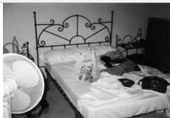
La pensione Vergara