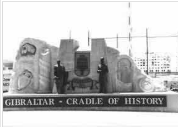
Gibilterra, "culla della storia"