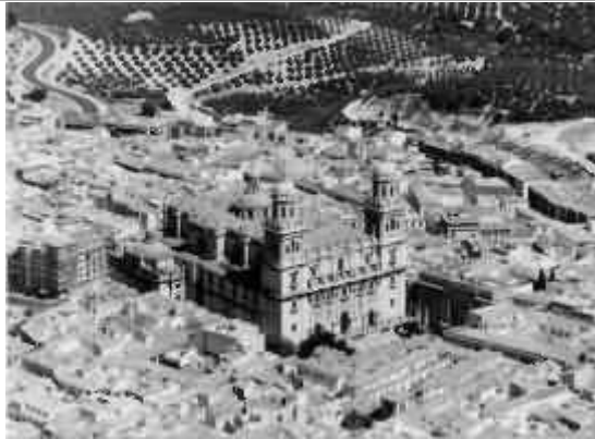
Jaén, la splendida cattedrale