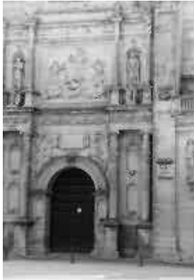
Úbeda, la chiesa