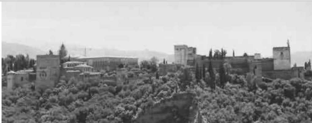
L'Alhambra vista dall'Albayzín (foto panoramica)