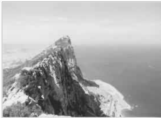
Gibilterra, la rocca