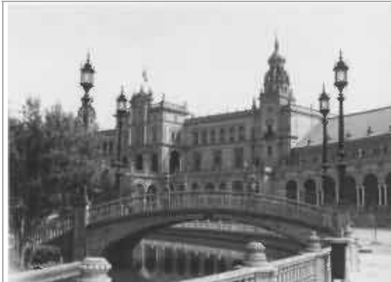
Plaza de España