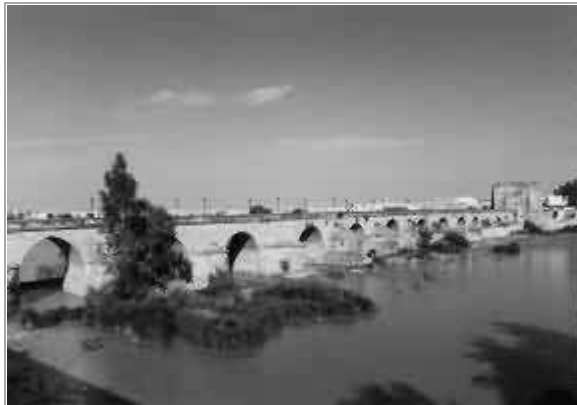
Il bel ponte di Córdoba