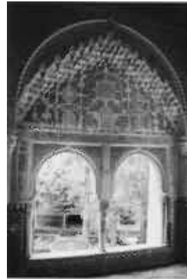
Generalife: un altro punto del parco