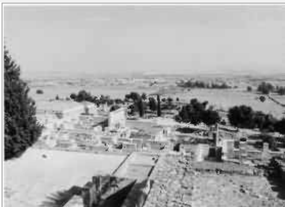
Medinat Az Zahara