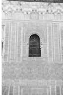
l'Alhambra: un particolare dell'interno