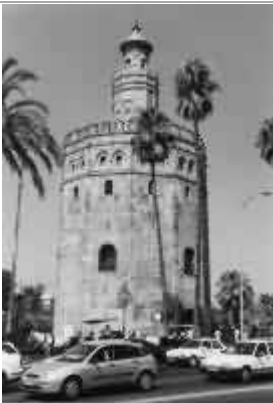
Torre del Oro