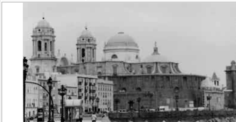
Cadice e la sua bella cupola gialla