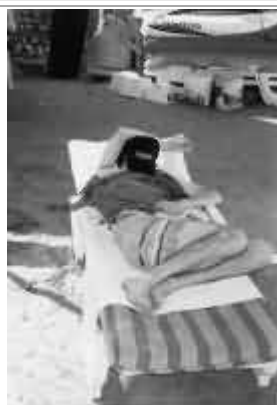
Il Giuva si spaparanza