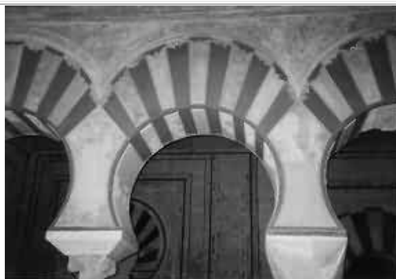
Medinat Az Zahara: particolare della volta