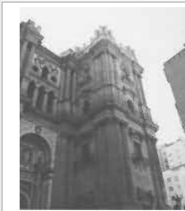
Málaga, la cattedrale (La Monquita)