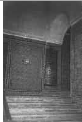
Casa de Pilatos