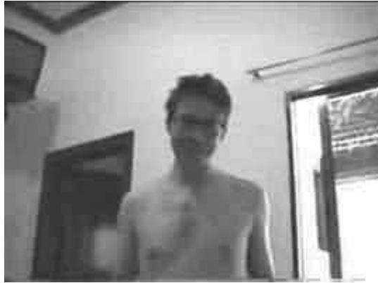
La clamorosa secchiata!