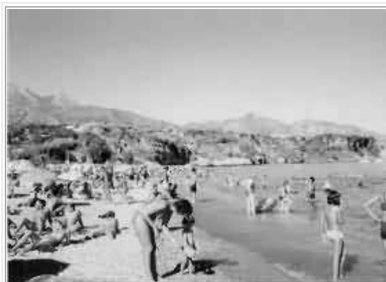
Finalmente, il mare!