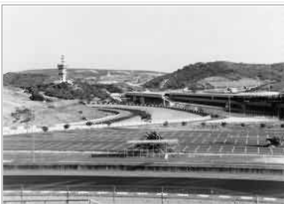
Jerez, Circuito di F1