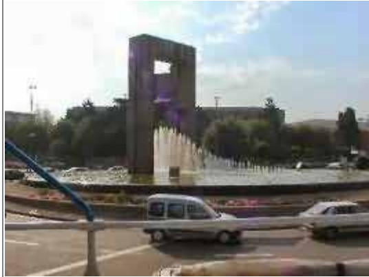
Vigo, Plaza de América