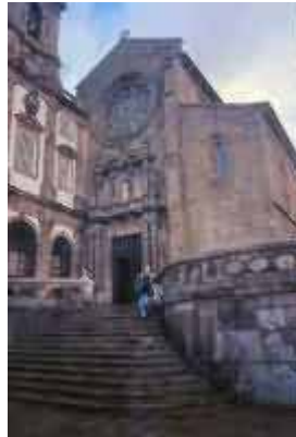
Chiesa a Porto