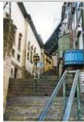
Il quartiere vecchio