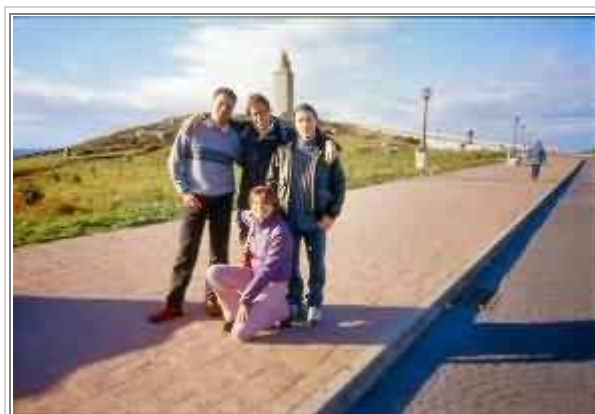
Tutti davanti alla Torre de Hercules!