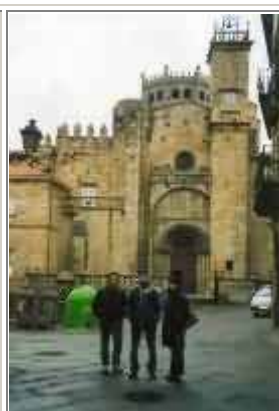
Chiesa di Ourense