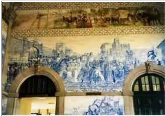
Stazione di Oporto