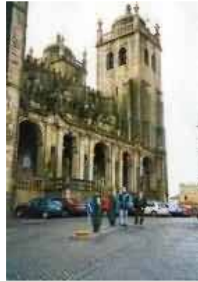
Cattedrale di Oporto