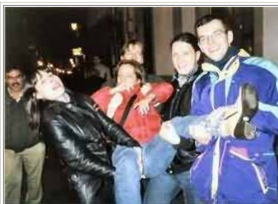
Festa ad Ourense!

Anche questa giornata è finita, ci attende una nuova corriera, destinazione A Coruña.