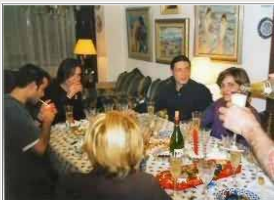
La grande abbuffata