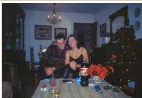
I preparativi per la festa