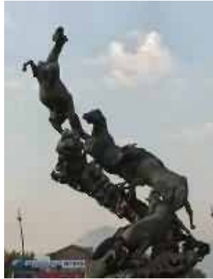
Vigo, Plaza de España